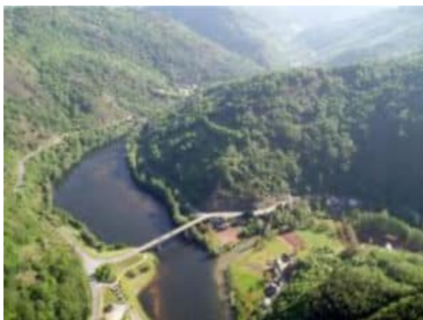
Tal des Lot

Jour 2 : Conques → Les Bréfinies: 10,5 km